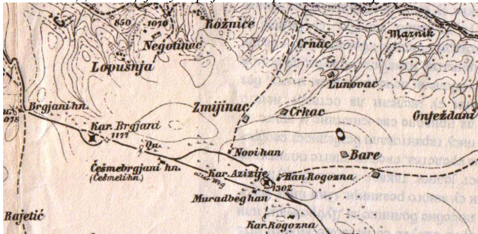
КАРТА 1: Део секције аустријске генералштабне карте

Геолог Фран Туђан, који је 1925. године обилазио Рогозну, детаљно је описао локални пут од хана Рогозна до Плакаонице. Прво село на које је наишао биле су Баре, што такође указује да се Рогозна налазила у реону Каравасалије, или у непосредној близини. 35